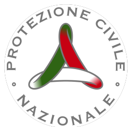
Gruppo comunale di Protezione Civile