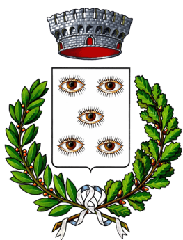
Comune di Occhieppo Inferiore