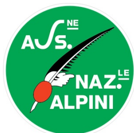
Associazione nazionale Alpini